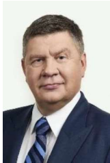
Aigars Kalvītis, 1966 Valdes priekšsēdētājs

Valdes pilnvaru termiņš no 2024. gada 16. augusta līdz 2025. gada 15. augustam.